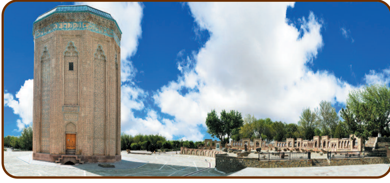
18 aprel Beynəlxalq Abidələr və Tarixi Yerlər Günüdür

Ümummilli liderimizin siyasi kursunun layiqli davamçısı ölkə Prezidenti cənab İlham Əliyevin diqqət və qayğısı ilə tarixi abidələrimizin bərpası, qorunması və tədqiqi mühüm tədbirlər sırasına çəkilmişdir. Bir sıra tarixi abidələrimiz YUNESKO-nun Dünya Mədəni İrs Siyahısına salınmışdır. Milli mədəni irsin qorunması istiqamətində aparılan islahatların davamı olaraq Azərbaycan Respublikası Prezidentinin 2013-cü il 27 dekabr tarixli Sərəncamı ilə “Daşınmaz tarix və mədəniyyət abidələrinin bərpası, qorunması, tarix və mədəniyyət qoruqlarının fəaliyyətinin təkmilləşdirilməsi və inkişafına dair 2014-2020-ci illər üzrə Dövlət Pro-